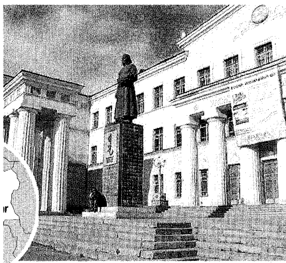
CULTURA La biblioteca mongola di Ulaanbaatar

«Insegnavo a Ulaanbaatar, ma non ci vado più»